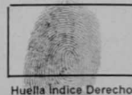
Huella Índice Derecho